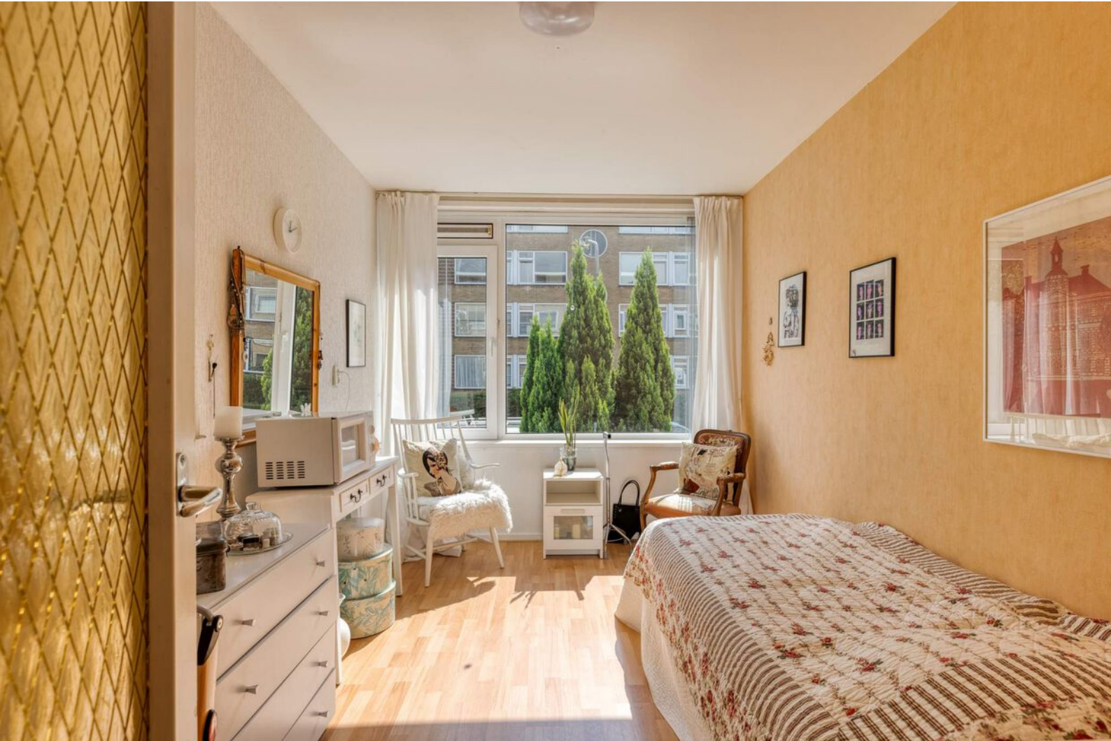
Slaapkamer met vaste kast aan de voorzijde. Tweede slaapkamer aan de achterzijde.