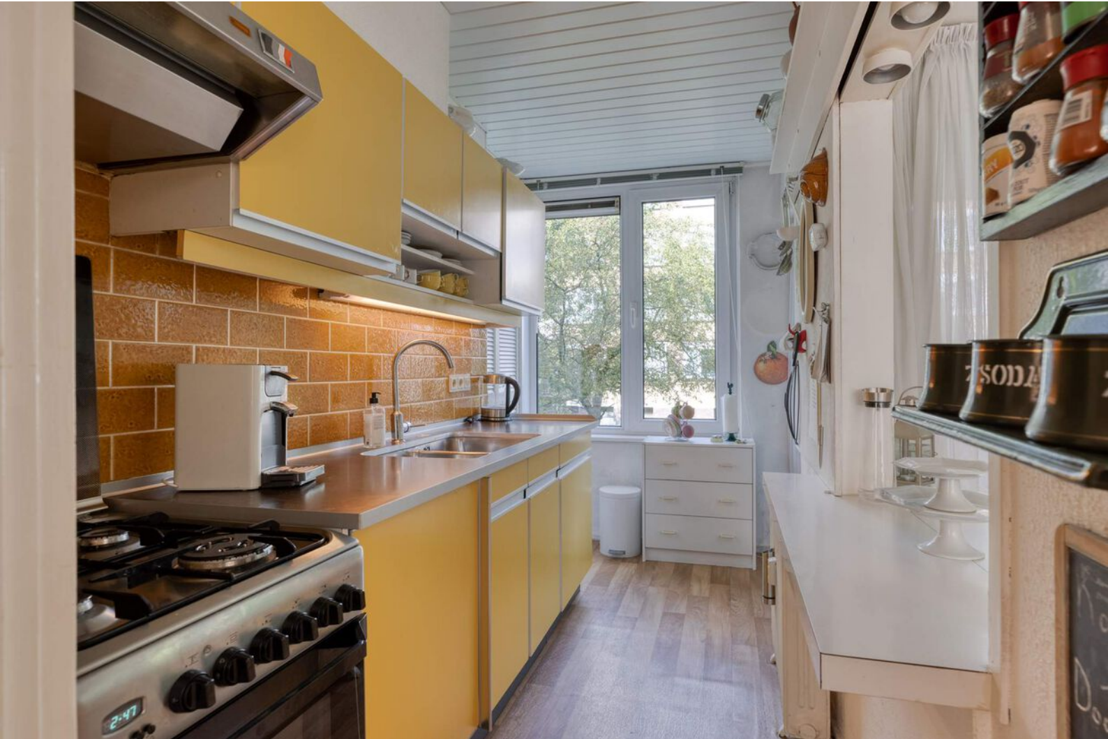
Dichte keuken met verouderd keukenblok